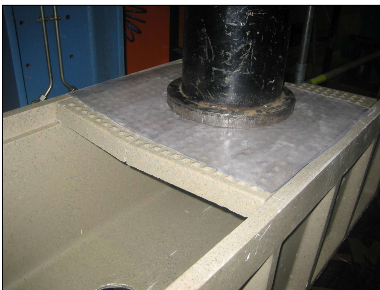
Foto 2. Disposición de ensayo